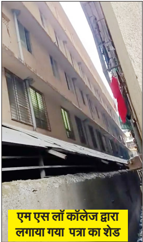
एम एस लॉ कॉलेज द्वारा लगाया गया पत्रा का शेड

अगर भविष्य में कोई दुर्घटना घटती है या जनहानि होती है तो मनपा प्रशासन के अधिकारी जिम्मेदार होगी यह तमाम समस्याओं को देखते हुए हम लोगों ने ठाणे मनपा प्रशासन की मुंब्रा प्रभाग समिति में और मुंब्रा पुलिस स्टेशन में लिखित शिकायत