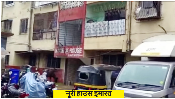
नूरी हाऊस इमारत