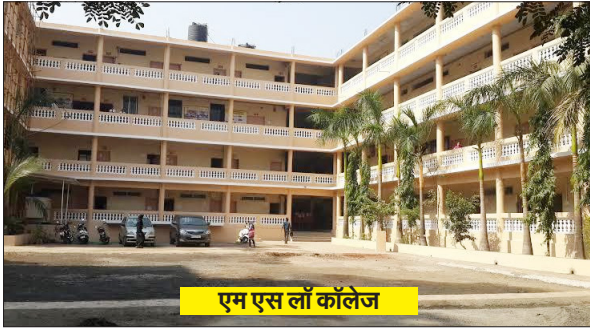
एम एस लॉ कॉलेज

मुंबई हलचल/अब्दुस समद खान मुंब्रा। कौसा स्थित कादर पैलेस परिसर में मौजूद एमएस लॉ कॉलेज अक्सर फीस भ्रष्टाचार को लेकर विवादों में रहता है अभी हाल ही में छात्राओं द्वारा जबर्न वसूली जा रही फीस को लेकर विवादों में था और अब स्थानीय रवासियों द्वारा पुरजोर विरोध किया जा रहा है मामला क्या है आपको बताते चले एमएस लॉ कॉलेज को लगकर वर्षों पहले बनी नूरी हाऊस नामी इमारत के रहवासियों द्वारा एमएस लॉ कॉलेज का पुरजोर विरोध किया जा रहा है क्योंकि लॉक डाउन के दौरान एमएस लॉ कॉलेज के प्रबंधन द्वारा पत्रा का शेड लगाया गया है जिससे बारिश के दौरान पत्रा से गुजर कर बहने वाला पानी सारा नूरी हाऊस नामी इमारत में आ रहा है जिससे तल मंजिले में रहने वाले मकान मालिकों को काफी दिक्कत का सामना बीते तीन वर्षों से करना पड़ रहा है इस मामले में नूरी हाऊस इमारत के रहवासी द्वारा बताया जा रहा है की लॉकडाउन के समय में एमएस लॉ कॉलेज प्रबंधन द्वारा पत्रा का शेड लगाया गया है जिससे बारिश के समय पत्रा का पूरा पानी हमारी इमारत नूरी हाऊस में घुस रहा है जिससे हमारी इमारत कमजोर होती चली जा रही है और हमारे घरों में पानी भर रहा है पानी भरने की वजह से दीवार में करंट उत्पन्न हो रहा है जिससे हमारे बच्चे को और घर में रहने वाले सदस्य को कभी भी करंट लगने से जान जाने का खतरा बना रहता है! पानी के कारण मच्छर और कई प्राणघातक बीमारी उत्पन्न हो रही है जिससे हमारे बच्चे उल्टी का शिकार हो रहे हैं लगातार पत्रा से पानी बहने की वजह से हमारी इमारत के कॉलम और भीम में भारी दरारें पड़ गई है हमारी इमारत की फाउंडेशन में बड़ी दरार आ गया है जिससे इमारत कभी भी गिर सकती है